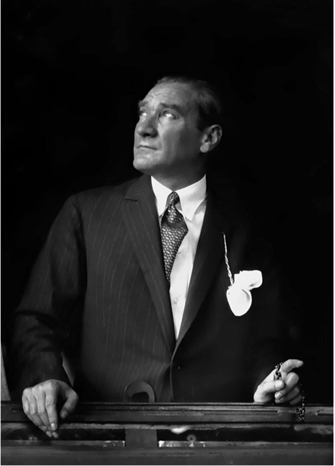
Mustafa Kemal ATATÜRK 1881-1938